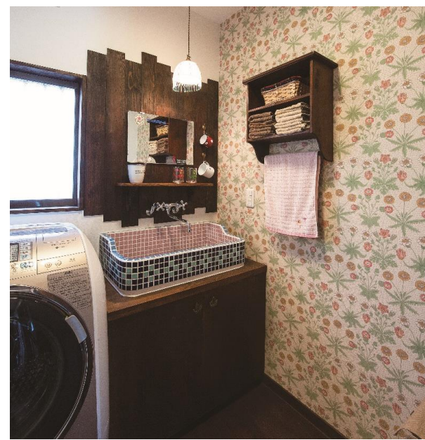
タイルを貼った洗面台と、ウィリアムモリスのアクセントクロスで印象的な場所に。